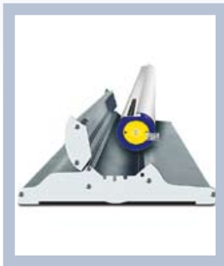
Die Grafik ist im Gehäuseinneren gut geschützt.

Für sein Design hat das Roll Up Classic in Schweden die Auszeichnung „Gebrauchs-Kunst“ erhalten. Das System ist leicht zu transportieren und in Sekunden aufgestellt. Es ist in mehreren Breiten erhältlich und ist sehr strapazierfähig – daher optimal für wiederholten Einsatz am POS.