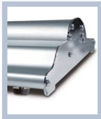
Ein stabiles Gehäuse mit verstellbaren Standfüßen.